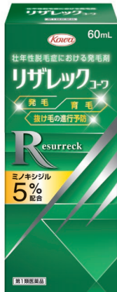
リザレックユーワ