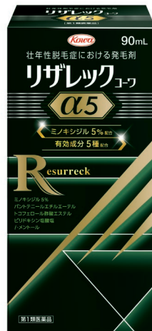
リザレックユーワ alpha 5