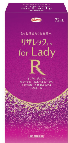
リザレックユーワ for Lady