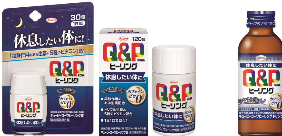
キューピーコーワヒーリング錠

休息したい体に！カフェインゼロでおやすみ前にも キューピーコーワヒーリング錠 新発売 キューピーコーワヒーリングドリンク 新発売