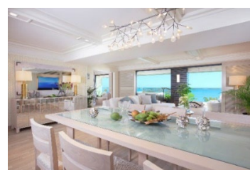
1つのフロアに1室のみ、各部屋 200㎡を超える贅沢なつくり