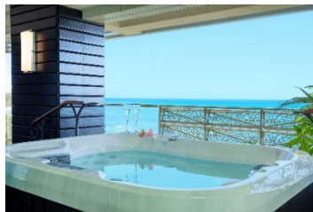
ワイキキビーチに臨む、各部屋の ラナイに備え付けのジャグジー